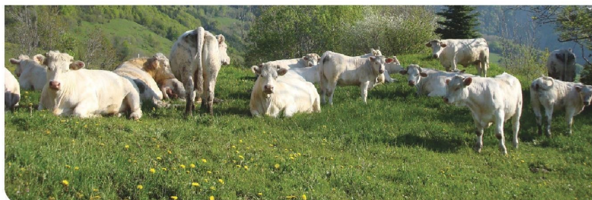
Herd Book Charolais - Agropôle du Marault - 58470 Magny-Cours - France