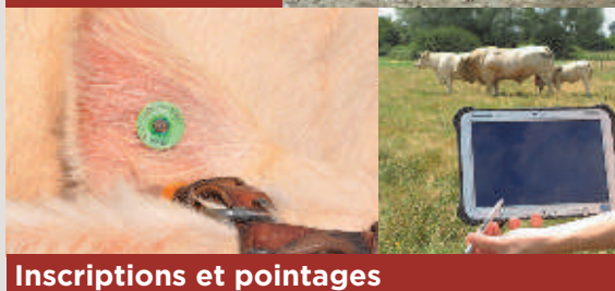
Inscriptions et pointages

Des conseils génétiques en toute objectivité, sur tous types de problématiques